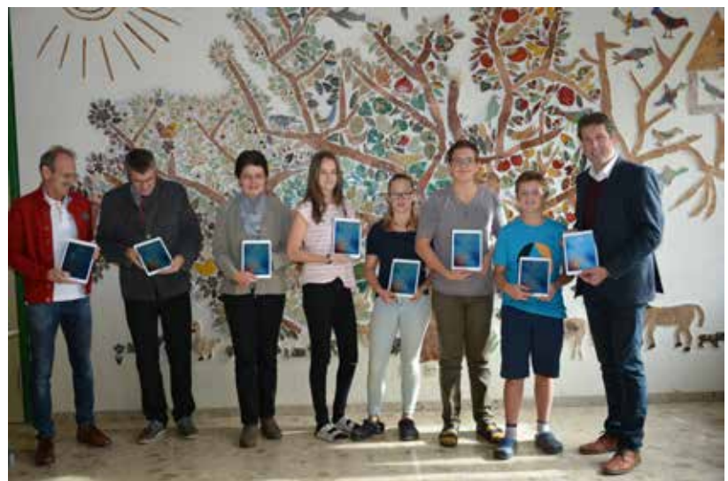
Die Schülerinnen und Schüler präsentierten stolz die neuen iPads.