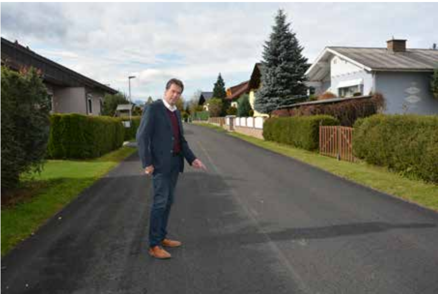
Optimierung der Asphaltsschicht am Kapellenweg.

richtet werden und unsere Projektvorhaben sogar mit einer zusätzlichen Ausweitung auf das Weggut „Am Lärchenhügel“ erfolgreich vollendet werden. Auch wenn natürlich alle diese Bauarbeiten mit Verkehrsbehinderungen und Lärmentwicklung verbunden sind und ich mich sehr bei den Anrainerinnen und Anrainern für das Verständnis bedanke, so möchte ich dennoch darauf hinweisen, dass wir uns die Sanierung und Optimierung der Infrastruktur in unserer Gemeinde zum Ziel gemacht haben, um für Sie bestmögliche Bedingungen zu schaffen.