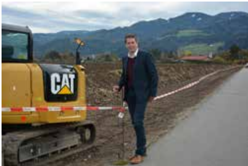
Geh- und Radweg in Lind sorgt für mehr Sicherheit.