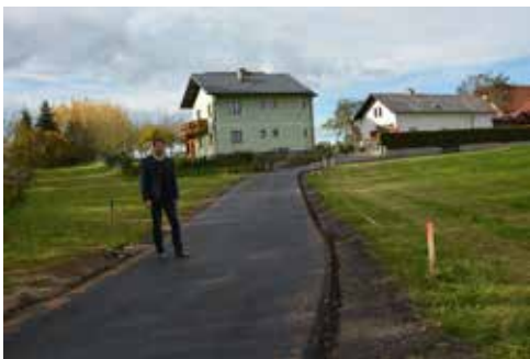
Der Lärchenhügel ist wieder gut befahrbar.

■ Dieses Jahr wurde von zahlreichen Straßenbauvorhaben und Sanierungsarbeiten begleitet. Einige Straßen mit sehr schlechtem Zustand konnten wieder herge-