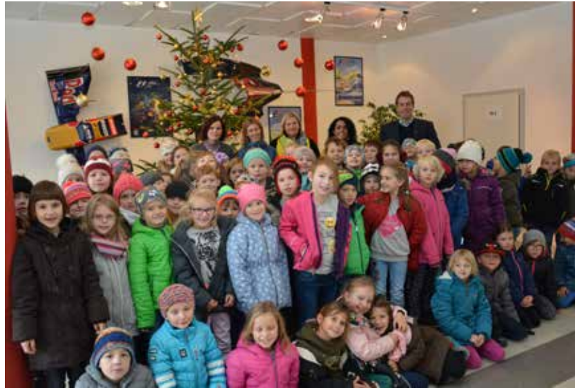
Funkelnde Lichter am Weihnachtsbaum und leuchtende Kinderaugen strahlten im Foyer der Stadtgemeinde um die Wette.