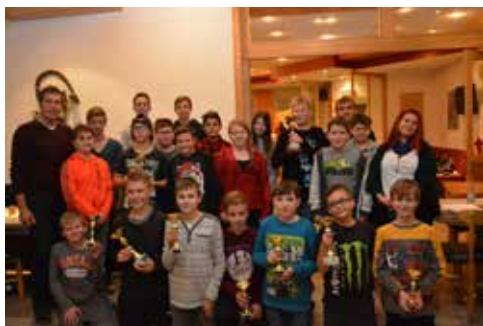
Mit Vollgas ging es für das Jugendformat in die Zielgerade.