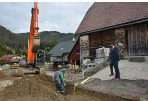
Die Leitungen für das neue Beleuchtungskonzept im Blüemetal wurden gleich mitverlegt.