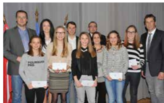
Die erfolgreichen Sportlerinnen aus dem Vorjahr

Die SportlerInnenehrung der Stadtgemeinde Spielberg findet am 02.03.2017 um 19:00 Uhr im Kultur im Zentrum statt.