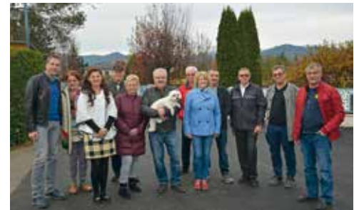
Fertiggestellt wurde unlängst auch der sanierte Straßenverlauf „Am Eichengrund“.

Auch „Am Eichengrund“ wurde in diesem Jahr eine umfangreiche und höchst not-