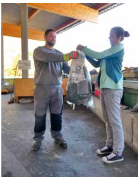
Restmüllsack erhalten Sie in Ihrem Gemeindeamt

Im ASZ Knittelfeld wird kein solches Dämmmaterial mehr angenommen!