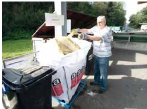
In solchen BigBags werden künstliche Mineralfasern gesammelt

angenommen, diese müssen selber mit der Firma Trügler oder anderen befugten Entsorgungsfirmen Kontakt aufnehmen.