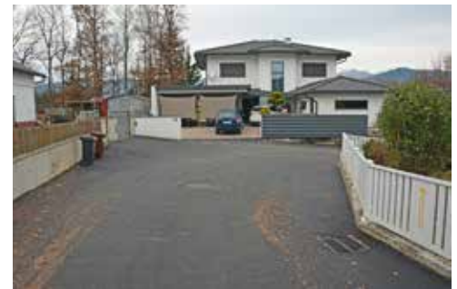
„An der Ingering“ wurden die Sanierungsmaßnahmen erfolgreich abgeschlossen.

■ Notwendige Sofortmaßnahmen wie kleine Reparaturen können oftmals vom Bauhof selbst ausgeführt werden, um den Erhalt einer Straße zu sichern und die Nutzungsdauer noch zu verlängern.