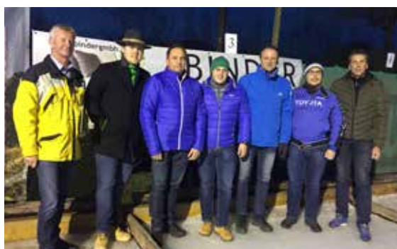
Die Steirerherzen sind die neuen Stadtmeister von Spielberg