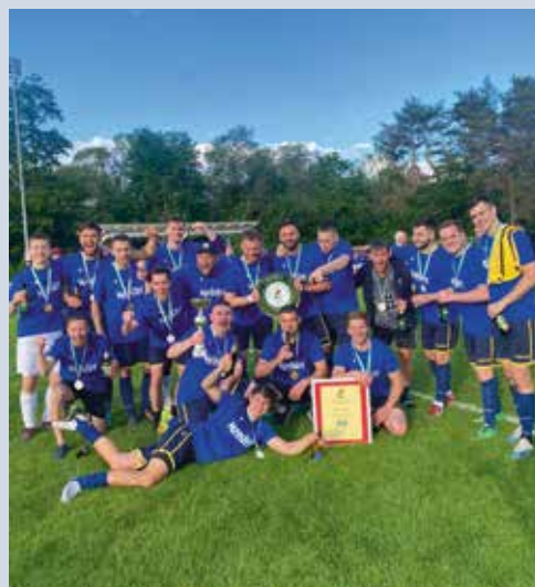
TUS RWS-Willibald Spielberg: Meistertitel Gebietsliga Mur und somit Aufstieg in die Unterliga Nord B

■ Am 11. Juni gab es in Spielberg so richtig Grund zum Feiern! Wir gratulieren unseren Fußballmeistern sowie allen Trainern und Funktionären und allen die mitfieberten und die Mannschaften stets als Fans unterstützen.