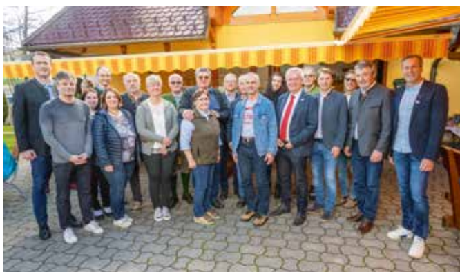
Die Bachgemeinschaft Pausendorf lud zum Bachfest

Aufgrund der Bauarbeiten beginnt das neue Schuljahr an der VS Maßweg heuer erst am Montag, 18. September 2023.