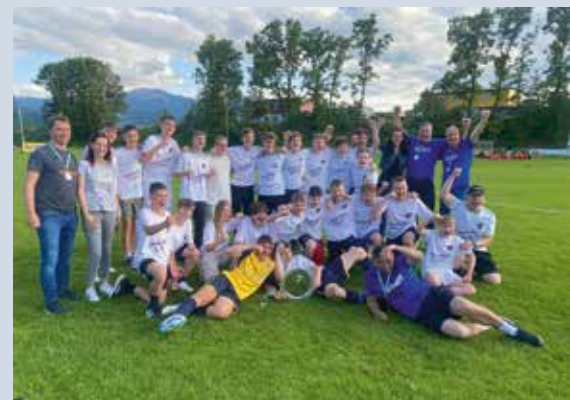
TUS Spielberg Youngsters: Meistertitel U15