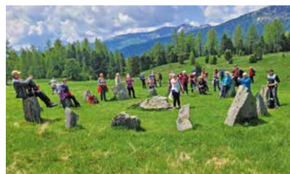
Die Gruppe beim Kraftplatz des 3 Seen Weges

Die Alpenfahrt führte heuer auf die Turrach. 76 Teilnehmer*innen genossen die wunderbare Landschaft im steirisch-kärntnerischen Grenzgebiet. Eine kleine Gruppe erklimmte den 2208 m hohen Schoberriegel. Eine größere Gruppe machte sich auf den 3 Seen Weg und bewunderte die Schönheit des Schwarz-, des Grün- und des Turrachsees. Nach vollbrachten Rundgängen genossen alle Teilnehmer das Mittagessen im Restaurant Turrachhof. Bei der Rückfahrt wurde im Gasthaus